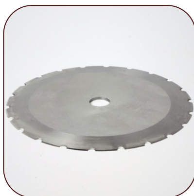
Couteaux pour Poisson