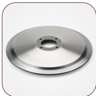
Couteaux Trancheurs pour Saumon