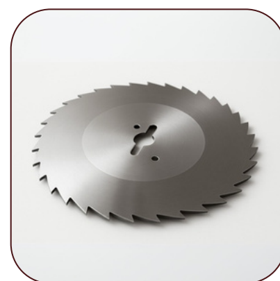
Couteaux pour Kebab