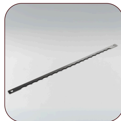
Couteaux Trancheurs à Pain