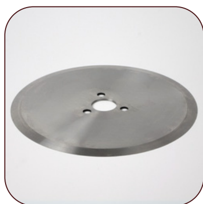
Couteaux de Découpe